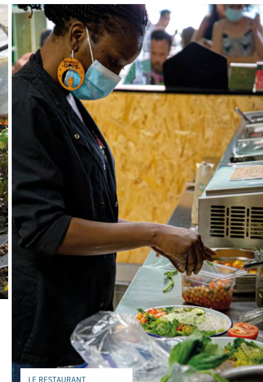
LE RESTAURANT KANTINETIK, SOUTENU EN 2020, PROPOSE DES REPAS ET DES ATELIERS DE SENSIBILISATION AUTOUR DE L'ALIMENTATION SAINTE ET DURABLE, À TROYES.

Le Fonds de Dotation Transatlantique a ainsi financé l'extension de son Jardin de Cocagne à Meaux, chantier d'insertion en maraîchage biologique qui favorise le retour à l'emploi durable des personnes éloignées du marché du travail. Le projet a permis d'accueillir le double de salariés en insertion et a bénéficié à 50 personnes en situation de précarité.