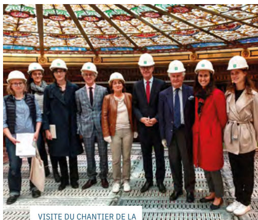
VISITE DU CHANTIER DE LA VERRIÈRE RESTAURÉE DE L'ÉGLISE SAINT-PHILIPPE-DU-ROULE, AUX CÔTÉS DE LA MAIRIE DE PARIS EN SEPTEMBRE 2020.